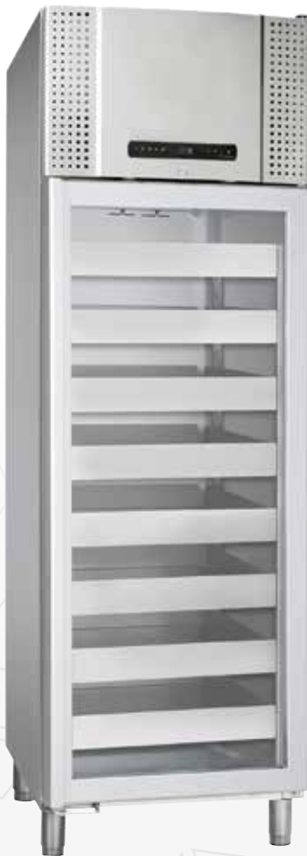
BioBlood BR660D. Tiroirs et porte vitrée sont en options.

Le concept de l'armoire BioBlood 600/660 est une version sur mesure pour répondre aux exigences spéciales du stockage du sang, du plasma, et des produits associés au sang.