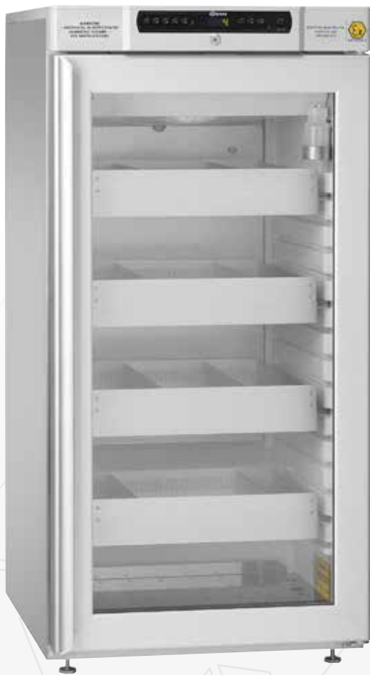
BioCompact II RR310. Lades, glasdeur en vloeistofhouder als optie mogelijk.

De BioCompact II 310 is een middelgrote koel- of vrieskast die weinig vloerruimte nodig heeft, bij uitstek geschikt is voor medische opslag en een grote koelcapaciteit koppelt aan een sterke prijs/kwaliteit verhouding.