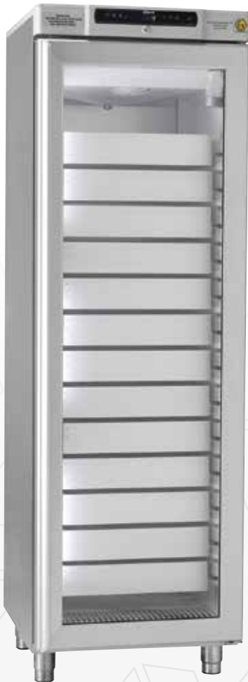
BioCompact II RR410. Lades, glasdeur en vloeistofhouder als optie mogelijk.

De BioCompact II 410 is een hoge koel- of vrieskast die weinig vloerruimte nodig heeft, bij uitstek geschikt is voor medische opslag en een grote koelcapaciteit koppelt aan een sterke prijs/kwaliteit verhouding.