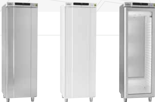
Geräte aus der Serie BioCompact II 410 sind als Kühl- oder Tiefkühlschränke in weiß lackiertem Stahlblech oder in Edelstahl erhältlich. Wählen Sie zwischen isolierter Glastür mit integriertem Licht (RR) oder massiver Tür.

Der BioCompact II 410 ist ein Standkühl- oder Tiefkühlschrank.