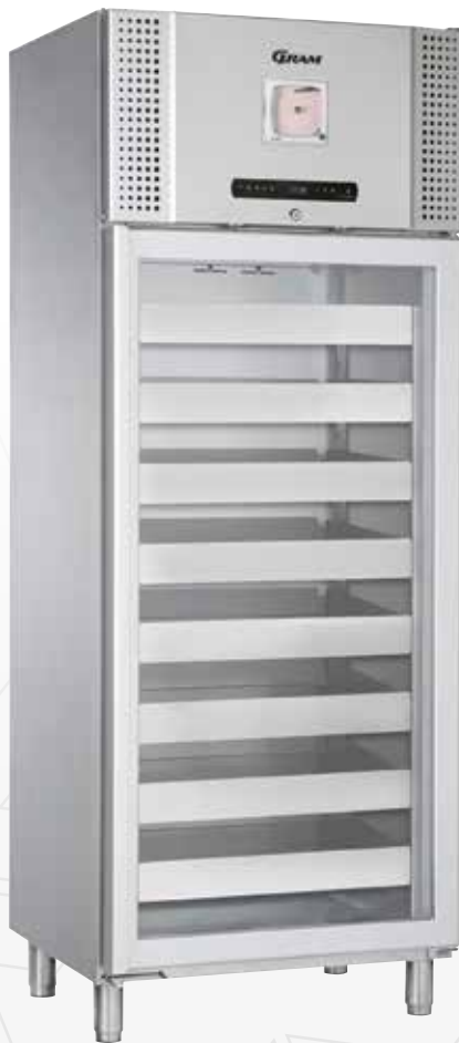
BioBlood BR 660W Tiroirs et enregistreur de température à disque sont en options.

Le concept de l'armoire BioBlood 600/660W est une version sur mesure pour répondre aux exigences spéciales du stockage du sang, du plasma, et des produits associés au sang.