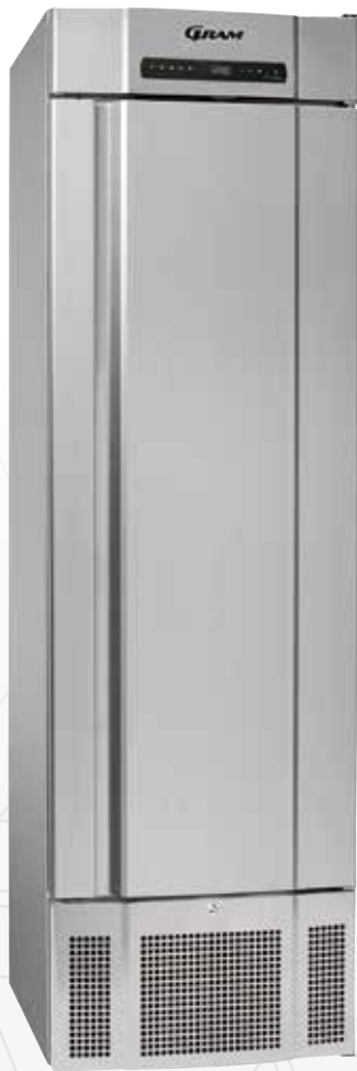
BioMidi EF425. Lades als optie mogelijk

De BioMidi EF425 is een lage temperatuur vriezer met een temperatuurbereik tussen -40/-5 °C. Het hoge-capaciteits koelsysteem waarborgt een snel herstel van de temperatuur in de binnenruimte van de kast na deuropening.