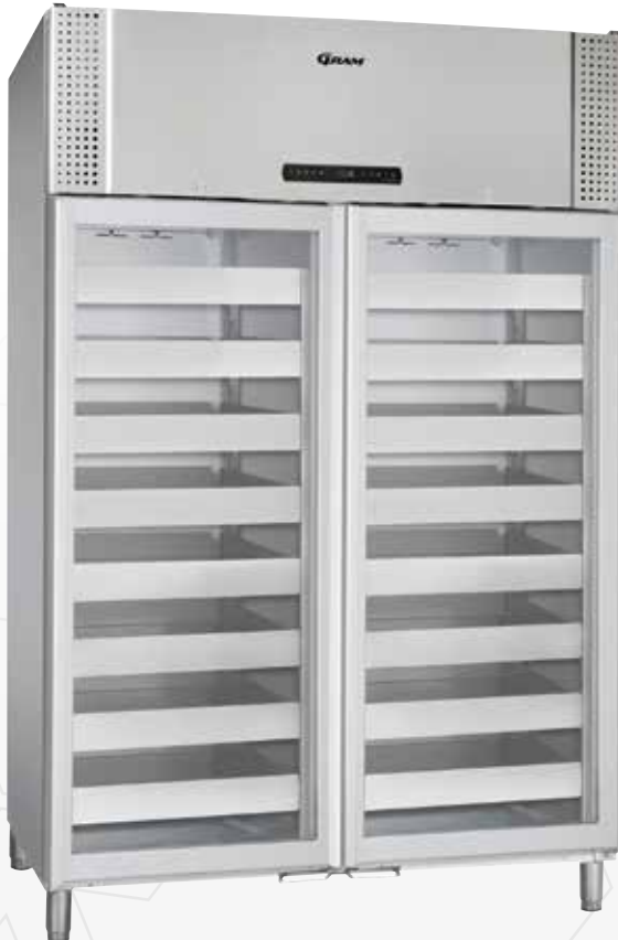
BioPlus 1400. Lades en glasdeur als optie mogelijk.

De BioPlus 1270/1400 serie is uitermate geschikt voor het bewaren van temperatuurgevoelige producten, waarbij iedere temperatuurschommeling grote invloed kan hebben op de producten.