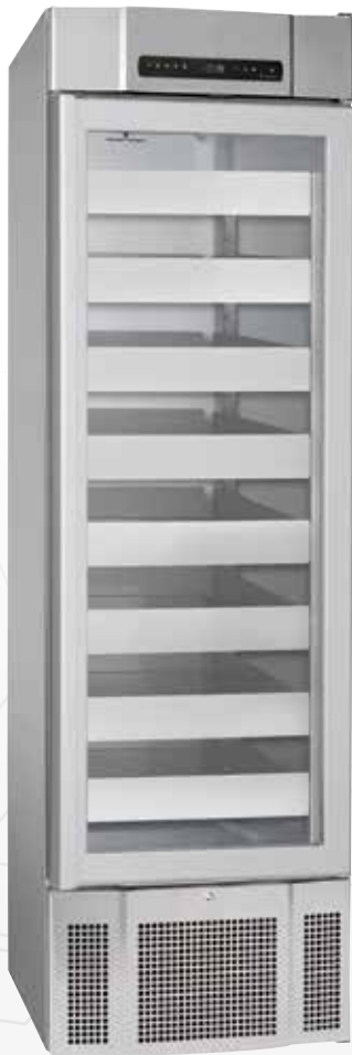
BioMidi 425. Lades en glasdeur als optie mogelijk.

De BioMidi 425 kasten zijn uitermate geschikt voor de opslag van farmaceutische producten.