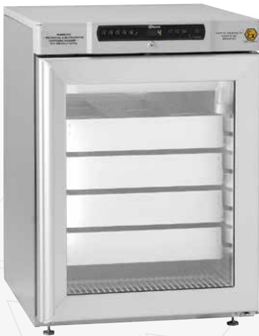
BioCompact II RR210. Lades, glasdeur en vloeistofhouder als optie mogelijk.

De BioCompact II 210 is een onderbouw koel- of vrieskast die weinig vloerruimte nodig heeft bij uitstek geschikt is voor medische opslag en een grote koelcapaciteit koppelt aan een sterke prijs/kwaliteit verhouding.