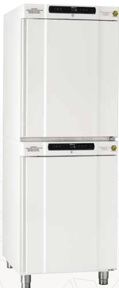
BioCompact RR210 / 210.

La BioCompact 210 / 210 est un réfrigérateur combiné et /ou un congélateur.